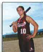
1 - 8x10 Individual