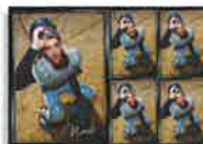
8x10 High Definition Gift Sheet