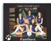
8x10 Bordered Team