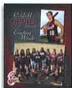
1 - 8x10 SportsMate