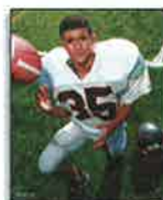
1 - 8x10 Individual