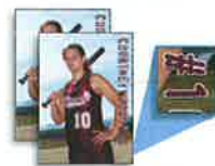
2 - 5x7 Personalized Prints (includes athlete's name & number)